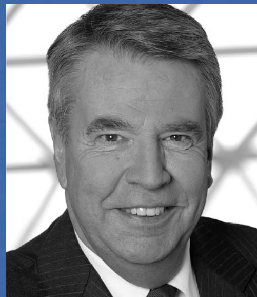
Dr. Helmut Linssen

Minister für Bauen und Verkehr des Landes Nordrhein-Westfalen